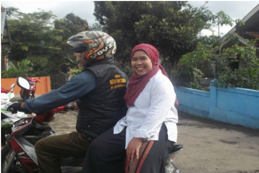
Gambar 34. Ojeg Mitra RW Siaga