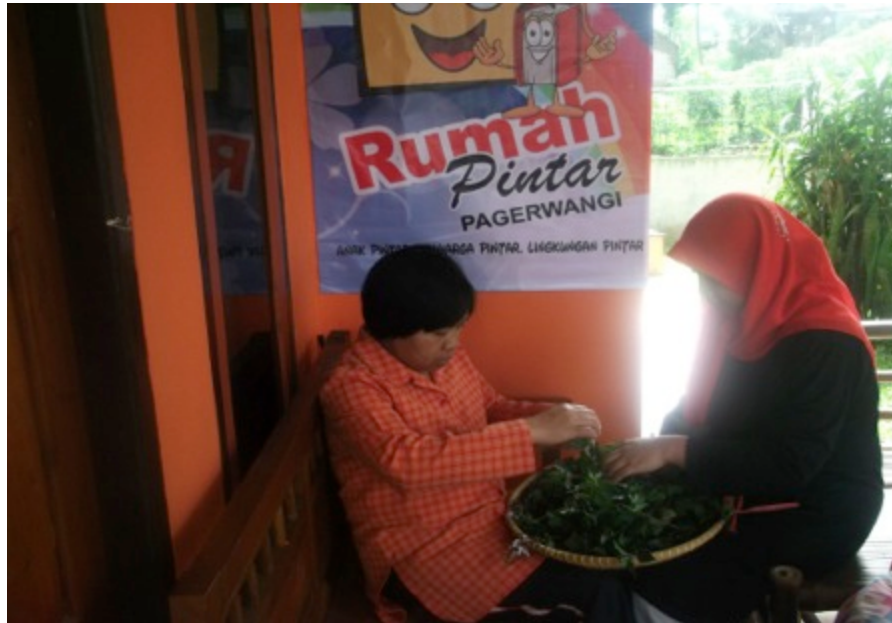
Gambar 32. Olahan Kumis Kucing