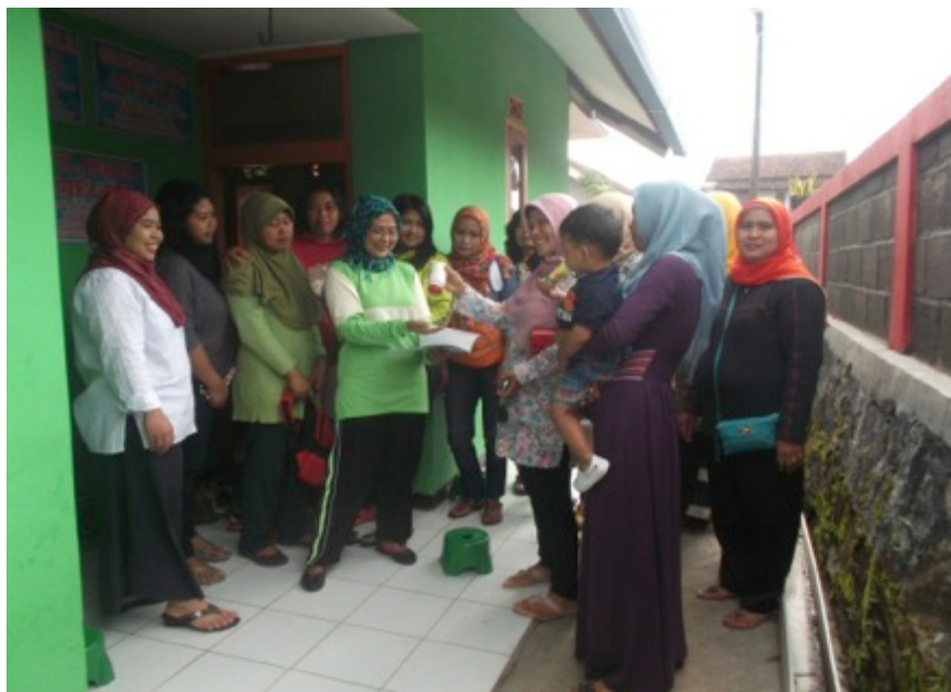
Gambar 33. Kelompok Mamah Balita Rajin (KEMBAR),